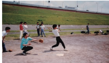
▲大学時代(4年)の球技大会

政治信条は、公正、共生、寛容。政治を志す原点は、学生時代の新聞奨学生体験。立憲民主党所属。