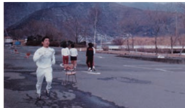
▲高校時代(1年)のマラソン大会