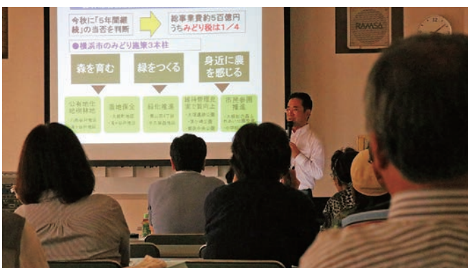
▲上・下ともタウンミーティング時に撮影